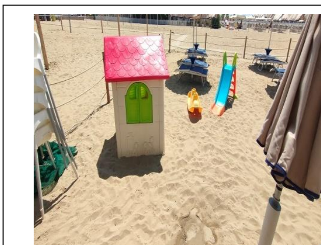
Area giochi su fondo sabbioso